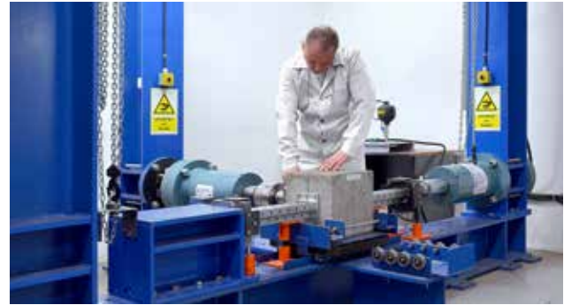
Laborator propriu de testari

Avem peste 1.300 de angajați în Europa. De asemenea, suntem reprezentați în Europa și în părți mari ale lumii, cum ar fi Africa, Orientul Mijlociu, SUA, Canada, America de Sud, Australia, cu o rețea extinsă de distribuție. Indiferent unde vă aflați, ca jucător global, suntem întotdeauna la dispoziția dumneavoastră.