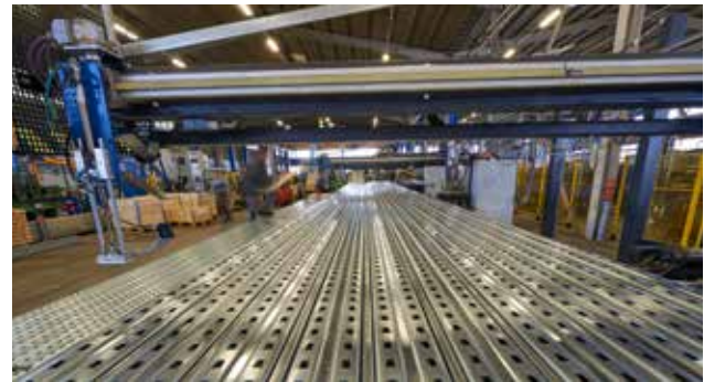
7 unități de producție