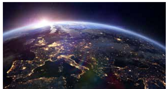
Peste 400 de angajați în relația directă cu clienții