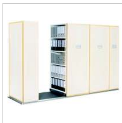
Compactus Office Electro