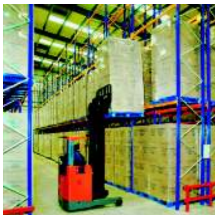
Stelaj cu culoar larg