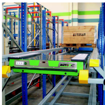
Sistem de depozitare cu satelit