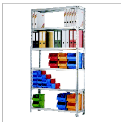
Rafturi cu profile perforate