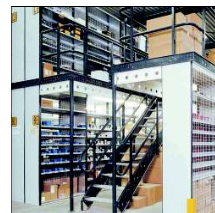
Rafturi ajustabile HI 280