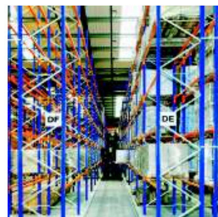
Stelaj cu culoar îngust